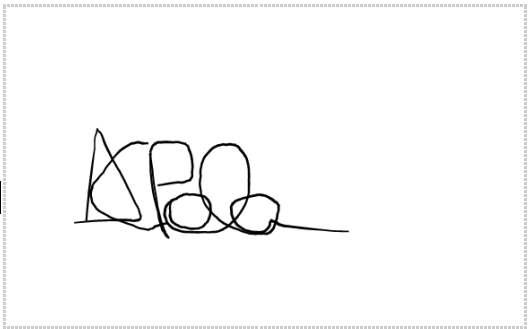
Assinatura de ANDRE CORREA POLATSCHECK

E-mail: [Redacted] [Redacted] [Redacted]