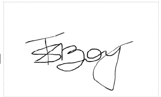
Assinatura de Thiago Silva Boy

Pontos de autenticação: Assinatura na tela IP: [REDACTED] / Geolocalização: [REDACTED] Dispositivo: Mozilla/5.0 (Windows NT 10.0; Win64; x64) AppleWebKit/537.36 (KHTML, like Gecko) Chrome/108.0.0.0 Safari/537.36 Edg/108.0.1462.54 Data e hora: 27 Dezembro 2022, 09:52:45 E-mail: t*****@transegurnet.com.br Telefone: +552799*****5 Token: 3736105c-****-****-****-2ad37ee36f6b